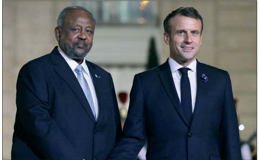
Le Président Emmanuel Macron et son homologue Ismaïl Omar Guelleh

À l'invitation de son homologue français, M. Emmanuel Macron, le Président de la République de Djibouti, M. Ismaïl Omar Guelleh a effectué entre les 11 et 13 février dernier, une visite officielle de 72 heures en France. Placée sous le signe du renforcement des relations d'amitié et de coopération entre les deux pays. Cette visite a vu la signature de plusieurs accords et lettres d'intention pour favoriser le renforcement des liens entre les deux pays et le développement de leur coopération dans tous les domaines, notamment culturels, scientifiques, militaires, économiques et environnementaux. Au cours de cette visite, le Président de la République de Djibouti a invité les entreprises françaises à participer activement aux côtés des entreprises djiboutiennes au développement de son pays qui offre des opportunités multiples et des garanties d'investissement à saisir.