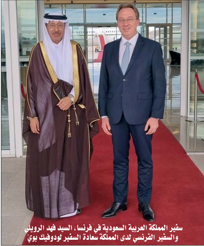
سفير المملكة العربية السعودية في فرنسا، السيد فهد الرويلي والسفير الفرنسي لدى المملكة سعادة السفير لودوفيك بوي

مقابلة مع سعادة سفير المملكة العربية السعودية لدى فرنسا السيد فهد الرويلي والسيد لودوفيك بوي السفير الفرنسي لدى المملكة العربية السعودية