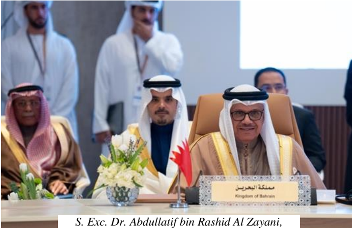
S. Exc. Dr. Abdullatif bin Rashid Al Zayani, Ministre des Affaires étrangères du Royaume

Avant la réunion de Paris, Bahreïn a pris part à la réunion ministérielle organisée par le Royaume d'Arabie saoudite le 12 janvier 2025.