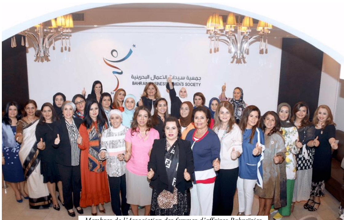
Membres de l'Association des femmes d'affaires Bahreïnies