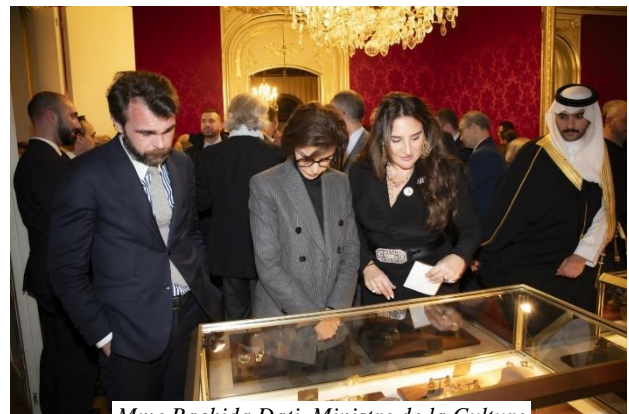
Mme Rachida Dati, Ministre de la Culture