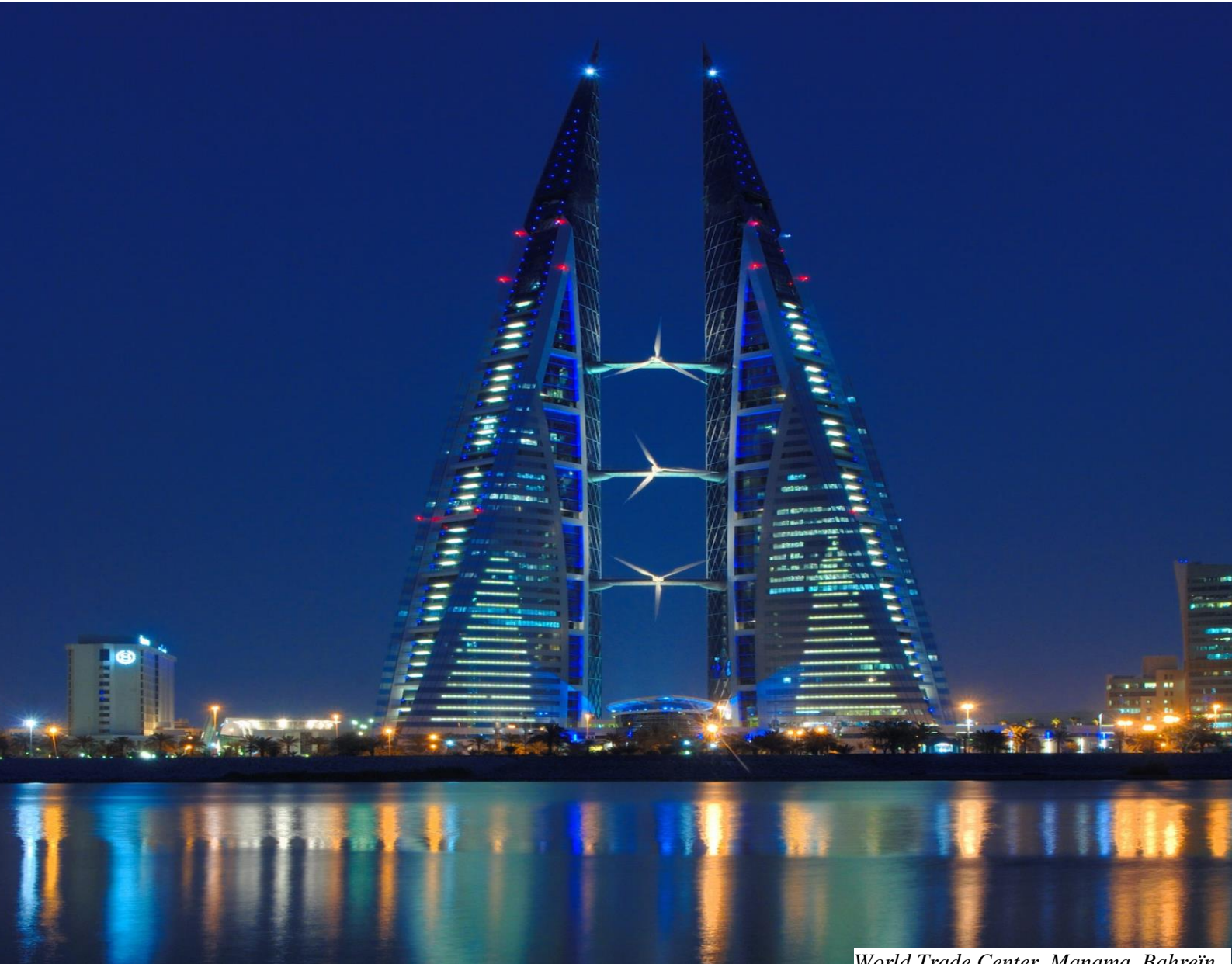
World Trade Center, Manama, Bahreïn