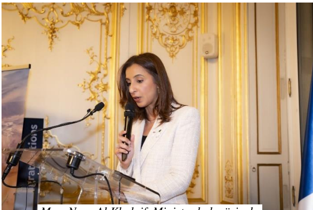
Mme Noor Al Khulaif, Ministre bahreïnienne du développement durable