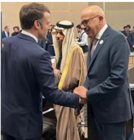
Le Président de la République française, M. Emmanuel Macron et le Ministre des Affaires étrangères de Bahreïn, Dr. Abdullatif bin Rashid Al Zayani

Lors de son allocution, le ministre des Affaires étrangères a souligné que la Conférence sur la Syrie témoigne d'un engagement commun en faveur d'une Syrie stable et prospère. Il a également adressé ses félicitations au Président de la transition syrienne, M. Ahmad al-Sharaa, pour son discours mettant en avant les aspirations du peuple syrien et pour les mesures prises, notamment le démantèlement des milices et des appareils de sécurité de l'ancien régime.