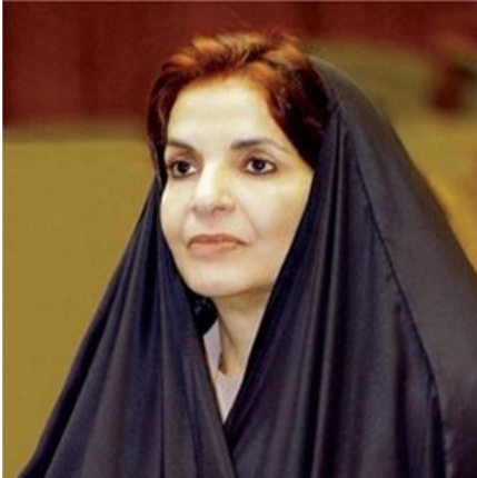
S. Altesse Royale la Princesse Sabeeka bint Ebrahim Al Khalifa

Sous le parrainage de Son Altesse Royale la Princesse Sabeeka bint Ebrahim Al Khalifa, épouse de Sa Majesté le Roi et présidente du Haut Conseil à la Femme, l'Association des femmes d'affaires bahreïnies a organisé un Forum international du 12 au 15 janvier dernier.