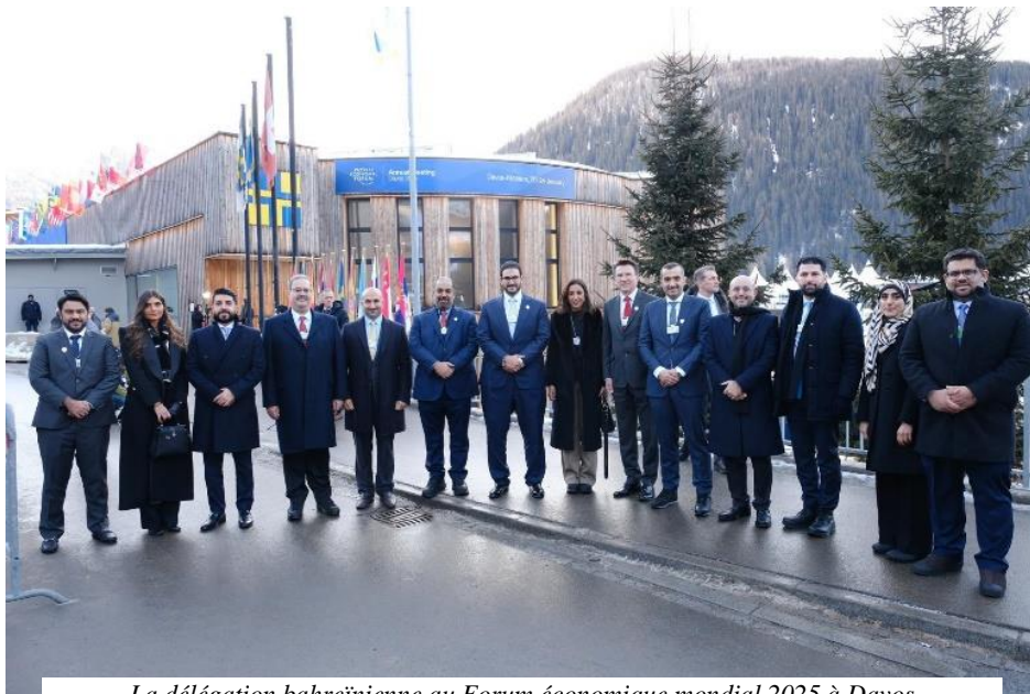
La délégation bahreïnienne au Forum économique mondial 2025 à Davos