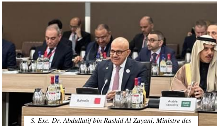
S. Exc. Dr. Abdullatif bin Rashid Al Zayani, Ministre des Affaires étrangères du Royaume