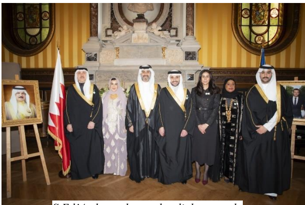
S.E. l'Ambassadeur et les diplomates du Royaume de Bahreïn en France