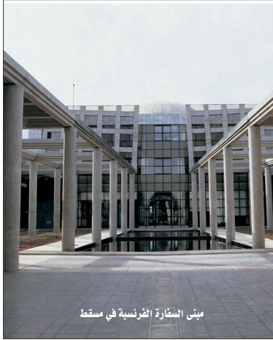
مبنى السفارة الفرنسية في مسقط

نحن الدولة الوحيدة التي لديها متحف مشترك عماني فرنسي، - بيت فرنسا، الذي كان مبناه في نهاية القرن التاسع عشر مقر القنصل الفرنسي آنذاك، وبمبادرة صداقة قوية تجاه فرنسا افتتح السلطان قابوس مع الرئيس الفرنسي فرانسوا ميتران هذا المتحف في عام ١٩٩٢. الجانب العماني قام بترميم وتجديد المبنى، ونحن نعمل باستمرار على تعزيزه، بفضل المساعدة والدعم التي توفرها الشركات الفرنسية، لكي يكون "بيت فرنسا" الواجهة للخبرات الفرنسية في مجال تنظيم وإدارة المتاحف.